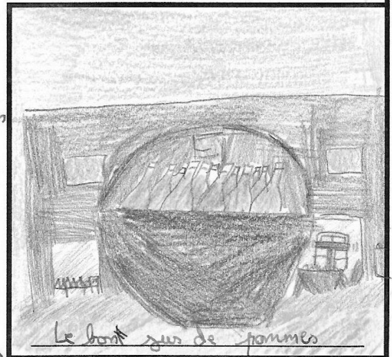
Le bont jus de pommes

Le mardi 17 octobre, nous sommes allés à Ecoflant pour faire le jus de pommes, avec l'association Espoir. Nous avons fait du jus de pommes pour l'école. En premier nous lavons les pommes pour les mettre dans des caisses puis, les pommes